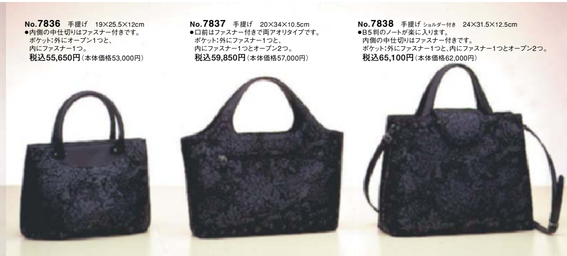
No.7836 手提げ 19×25.5×12cm ●内側の中仕切りはファスナー付きです。 ポケット:外にオープン1つと、 内にファスナー1つ。 税込55,650円(本体価格53,000円)