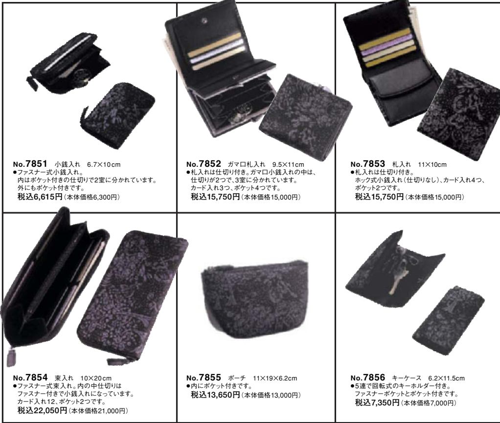
No.7851 小銭入れ 6.7×10cm ●ファスナー式小銭入れ。 内はポケット付きの仕切りで2室に分かれています。 外にもポケット付きです。 税込6,615円(本体価格6,300円)