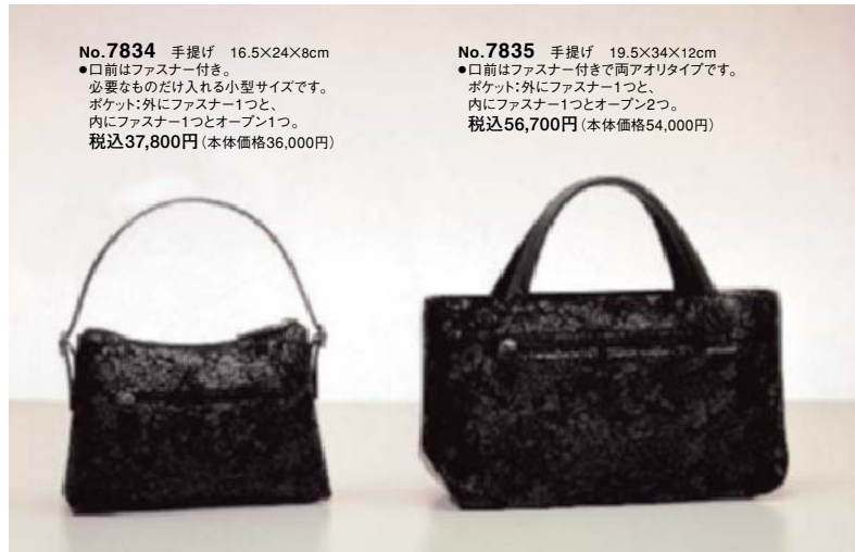
No.7834 手提げ 16.5×24×8cm ●口前はファスナー付き。 必要なものだけ入れる小型サイズです。 ポケット:外にファスナー1つと、 内にファスナー1つとオープン1つ。 税込37,800円(本体価格36,000円)