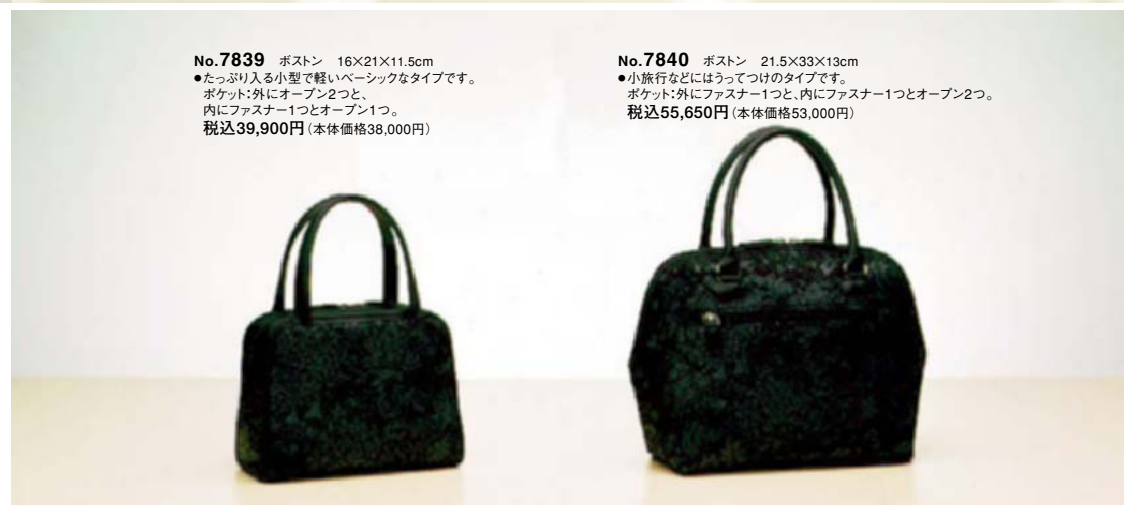
No.7839 ポストン 16×21×11.5cm ●たっぷり入る小型で軽いベーシックなタイプです。 ポケット:外にオープン2つと、 内にファスナー1つとオープン1つ。 税込39,900円(本体価格38,000円)

ポルカンドの柄について 森と音楽の物語。ヴァイオリンの音に森の生命が踊りだす。木々は光と戯れ、鳥たちは恋を語り、いのちの喜びを歌う。 自然や音楽がもたらす穏やかで安らかな、心に映るイメージを表現してみました。 黒染めの鹿革にグレーの更紗染と黒漆を用いて、印伝ならではの奥行きのある絵画的な柄を仕上げました。