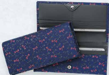
No.7520 束入 9.2×19×3.2cm ・札入1、カードポケット14、ポケット4 ・ファスナーポケット1 ・外側ポケット1 本体価格 20,000円+税