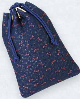
No.7505 合切袋 26.5×19×1.5cm ・内側ファスナーポケット1 本体価格 18,000円+税