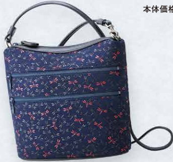
No.7514 ポシェット 19×21×7.5cm ・内側ファスナーポケット1 ・外側ファスナーポケット2 本体価格 29,500円+税