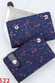
No.7522 カードケース 7×11×1.3cm ・クリアポケット10 本体価格 5,200円+税