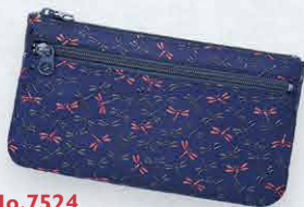
No.7524 ポーチ 11×19×2.1cm ・内側カードポケット3、 ファスナーポケット1 ・外側ファスナーポケット1 本体価格 9,800円+税