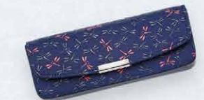
No.7523 メガネケース 6×16×3cm ・ハードタイプ 本体価格 7,500円+税