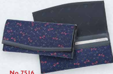
No.7516 束入 9×19×2.2cm ・札入1、カードポケット10、ポケット2 ・ファスナーポケット1 本体価格 14,500円+税