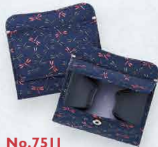
No.7511 小銭入 9.7×10.5×1.5cm ・紙幣も二つ折りで入ります ・ボックス型に開く小銭入1、ポケット2 本体価格 7,100円+税