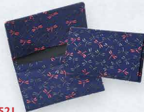
No.7521 名刺入 7×11×1.3cm ・ポケット3 ・脇にマチ付き 本体価格 6,500円+税