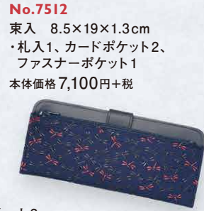
No.7512 束入 8.5×19×1.3cm ・札入1、カードポケット2、 ファスナーポケット1 本体価格 7,100円+税