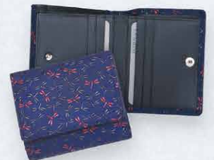
No.7527 札入 10×11×3.5cm ・札入2、カードポケット6、ポケット2 ・背にボックス式小銭入 本体価格 16,000円+税