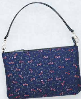
No.7525 手提げ 14×22.5×4.5cm ・口前はファスナー式 ・内側ポケット1、ファスナーポケット1 ・外側ファスナーポケット1 ・手紐は取り外しができます 本体価格 22,000円+税