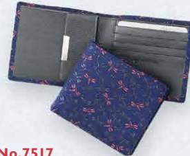
No.7517 札入 9.8×11.2×2.5cm ・札入2、カードポケット4、 ポケット2、ホック式小銭入1 本体価格 11,000円+税