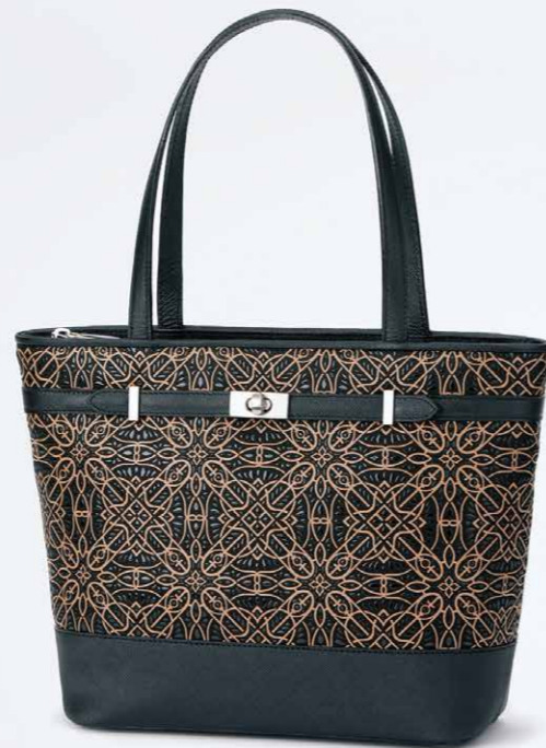
No.7806 手提げ 24×33×11.5cm

口前はファスナーで両アオリポケットと内側にオープンポケットが1つ付いています。 ポケット：外にファスナー1つ。 内にファスナー1つとオープン1つ。 本体価格 65,000円+税