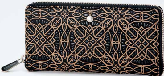
No.7823 束入 10×19.5×2cm ラウンドファスナー式で、内側のファスナー式小銭入は、 中仕切りで2室に分かれています。 ほかに札入2つ、カードポケット16、ポケット2つ。 本体価格 30,000円+税