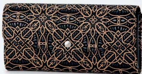
No.7824 束入 10×19.5×4.5cm 外側にポケット1つ。内側のファスナー式小銭入は、 中仕切りで2室に分かれています。 ほかに札入3つ、カードポケット16、ポケット4つ。 本体価格 31,000円+税