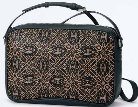
No.7801 ショルダー 20×29×8cm

"permanently" (永久)を基に、インド更紗とアラベスクのテイスト、日本の印傳屋の伝統を一体化した"one"を融合させたものです。