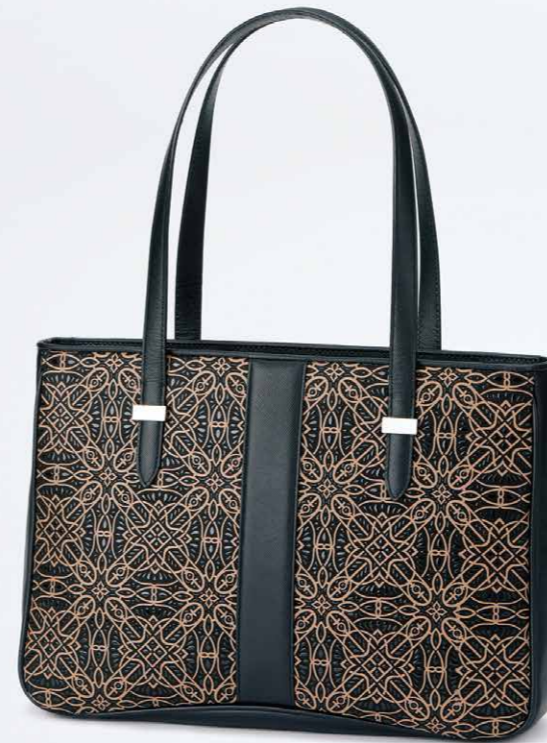
No.7802 セミショルダー 25×35×9cm

口前はファスナーで、両アオリポケットと内側にオープンポケットが1つ付いています。 ポケット：外にファスナー1つ。 内にファスナー1つとオープン1つ。 本体価格 71,000円+税