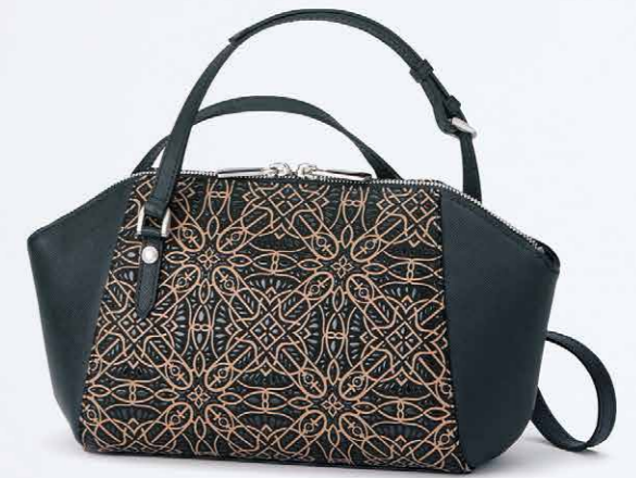
No.7804 ポシェット 16×31×9cm

口前はファスナーです。 ポケット：内にファスナー1つとオープン1つ。 本体価格 46,000円+税