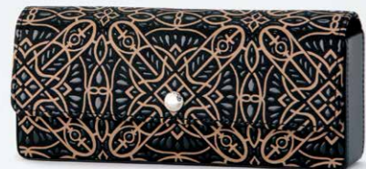
No.7825 メガネケース 7×16×3cm ホック式のハードタイプです。 本体価格 13,000円+税