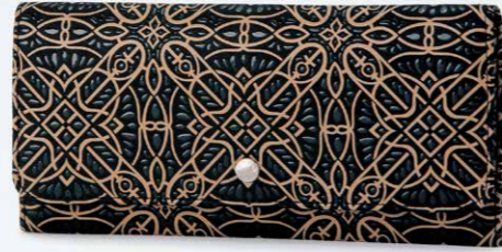
No.7822 束入 9×19.5×1.5cm 外側にファスナー式小銭入1つ、ポケット1つ。 ほかに札入1つ、カードポケット10、ポケット2つ。 本体価格 25,000円+税