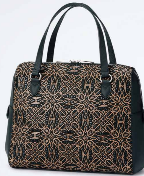
No.7807 手提げ 24×33×10cm

口前はファスナーです。 ポケット：外にオープン1つ。 内にファスナー1つとオープン1つ。 本体価格 66,000円+税