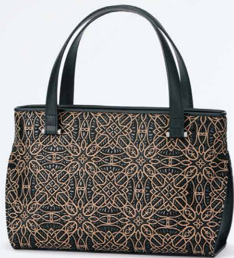
No.7805 手提げ 18×30×10.5cm

口前はファスナーで両アオリポケットと内側にオープンポケットが1つ付いています。 ポケット：内にファスナー1つとオープン1つ。 本体価格 52,000円+税