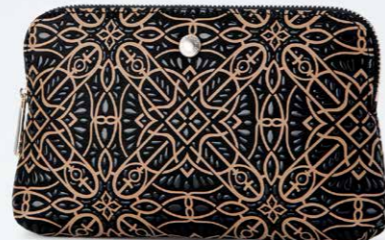
No.7826 ポーチ 10.5×16.5×2.5cm 口前はファスナーです。内側にポケット2つ。 本体価格 13,000円+税