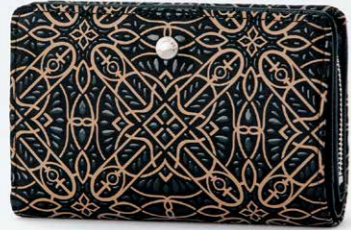
No.7821 札入 10×14×3cm 外側のファスナー式小銭入は、 中仕切りで2室に分かれており、ポケット2つ。 ほかに札入2つ、カードポケット8つ、ポケット3つ。 本体価格 23,000円+税