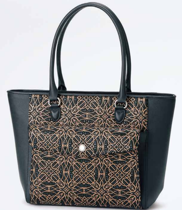
No.7808 手提げ 24.5×36×12cm

口前はファスナーで両アオリポケットと内側にオープンポケットが1つ付いています。 ポケット：外にマグネット止めのポケット1つ。 内にファスナー1つとオープン1つ。 本体価格 75,000円+税