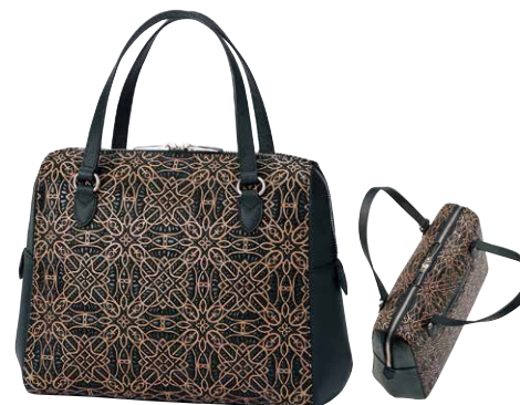
No.7807 手提げ 24×33×10cm

口前はファスナーです。 ポケット：外にオープン1つ。 内にファスナー1つとオープン1つ。