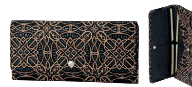
No.7822 束入 9×19.5×1.5cm

外側にファスナー式小銭入1つ、ポケット1つ。 ほか札入1つ、カードポケット10、ポケット2つ。