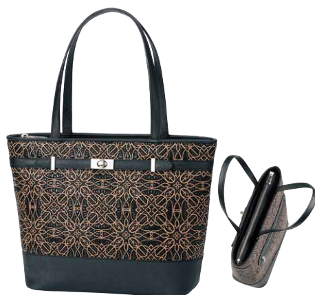
No.7806 手提げ 24×33×11.5cm

口前はファスナーで、両アオリポケットと 内側にオープンポケットが1つ付いています。 ポケット：外にファスナー1つ。 内にファスナー1つとオープン1つ。