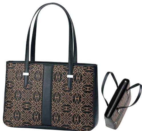
No.7802 セミショルダー 25×35×9cm

口前はファスナーで、両アオリポケットと 内側にオープンポケットが1つ付いています。 ポケット：外にファスナー1つ。 内にファスナー1つとオープン1つ。