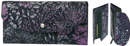
No.7224 束入 10.2×20×2.3cm 外側にファスナー式小銭入付き。 内側に札入1つ、カードポケット16、ポケット3つ。 税込33,000円(本体価格30,000円)