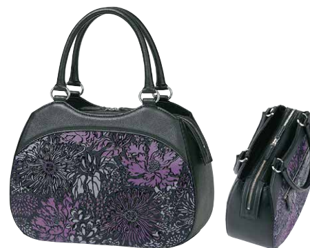
No.7209 手提げ 22×30.5×11cm