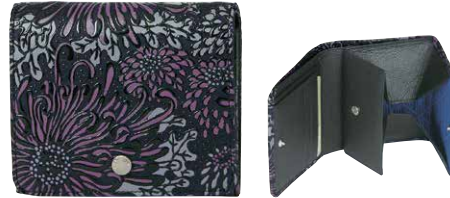
No.7222 札入 11.2×9.5×3cm 内側にボックス型に開く小銭入付き。 ほか札入2つ、カードポケット3つ、ポケット6つ。 税込26,400円(本体価格24,000円)