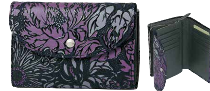
No.7223 札入 14×10×3.5cm 外側のファスナー式小銭入は 両面がポケットになった中仕切り付き。 ほか札入2つ、カードポケット10、ポケット3つ。 税込34,100円(本体価格31,000円)