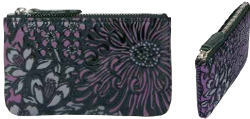
No.7221 小銭入 7×12×1cm 内側にポケット1つ。 税込8,250円(本体価格7,500円)