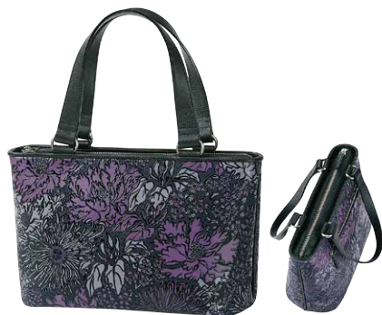
No.7207 手提げ 18.5×31×10cm