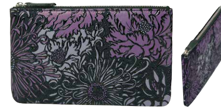
No.7226 ポーチ 11.2×19×1.5cm 内側にポケット1つ。 税込15,950円(本体価格14,500円)