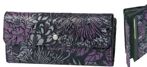
No.7225 束入 9.5×20×3.5cm 外側のファスナーポケットは 両面がポケットになった中仕切り付き。 内側に札入1つ、カードポケット16、ポケット2つ。 税込36,300円(本体価格33,000円)