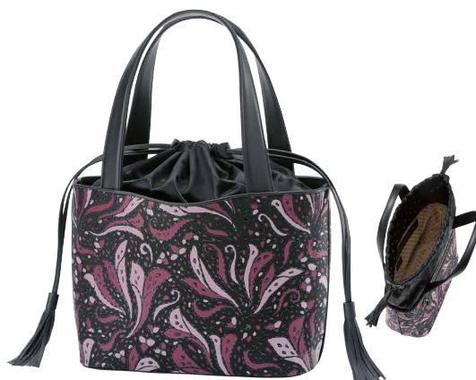
No.8707 | FR-7ハンドバッグ

価格：税込72,600円(本体価格66,000円) サイズ：[H]21.5×[W]26.5×[D]12cm 重量：420g 外側：口前はファスナー式／マグネット留めポケット×2 内側：ファスナー式ポケット×1／オープンポケット×1 ※在庫がなくなり次第、販売終了となります。