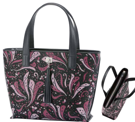
No.8708 | FR-8ハンドバッグ

価格：税込77,000円(本体価格70,000円) サイズ：[H]21×[W]31×[D]13cm 重量：450g 外側：口前は巾着形のしぼり式／ファスナー式ポケット×1 内側：ファスナー式ポケット×1／オープンポケット×1 ※在庫がなくなり次第、販売終了となります。