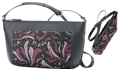
No.8701 | FR-1ショルダー

価格：税込69,300円(本体価格63,000円) サイズ：[H]20×[W]33×[D]9.5cm 重量：390g 外側：口前はファスナー式／オープンポケット×1 内側：ファスナー式ポケット×1／オープンポケット×1 ※在庫がなくなり次第、販売終了となります。