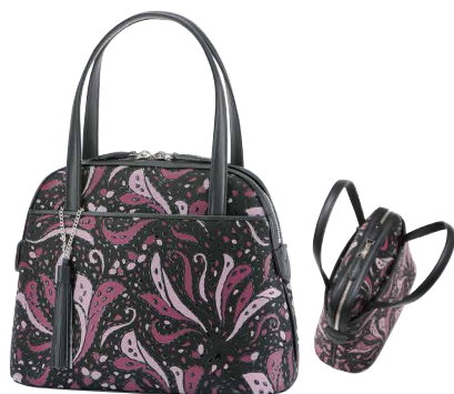
No.8706 | FR-6ハンドバッグ

価格：税込58,300円(本体価格53,000円) サイズ：[H]18.5×[W]25.5×[D]9.5cm 重量：350g 外側：口前はマグネット留め／ファスナー式ポケット×1 内側：ファスナー式ポケット×1／オープンポケット×1 ※在庫がなくなり次第、販売終了となります。