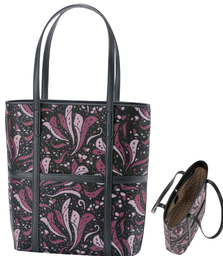
No.8703 | FR-3セミショルダー

価格：税込69,300円(本体価格63,000円) サイズ：[H]20×[W]33×[D]9.5cm 重量：390g 外側：口前はファスナー式／オープンポケット×1 内側：ファスナー式ポケット×1／オープンポケット×1 ※在庫がなくなり次第、販売終了となります。