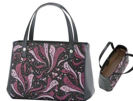
No.8705 | FR-5ハンドバッグ

価格：税込64,900円(本体価格59,000円) サイズ：[H]24×[W]28.5×[D]9cm 重量：380g 外側：口前はファスナー式／オープンポケット×1 内側：ファスナー式ポケット×1／オープンポケット×1 ※在庫がなくなり次第、販売終了となります。