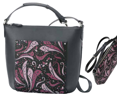
No.8704 | FR-4ポシェット

価格：税込90,200円(本体価格82,000円) サイズ：[H]32.5×[W]31×[D]11cm 重量：520g 外側：口前はマグネット留め／オープンポケット×2 内側：ファスナー式ポケット×1／オープンポケット×2 ※在庫がなくなり次第、販売終了となります。